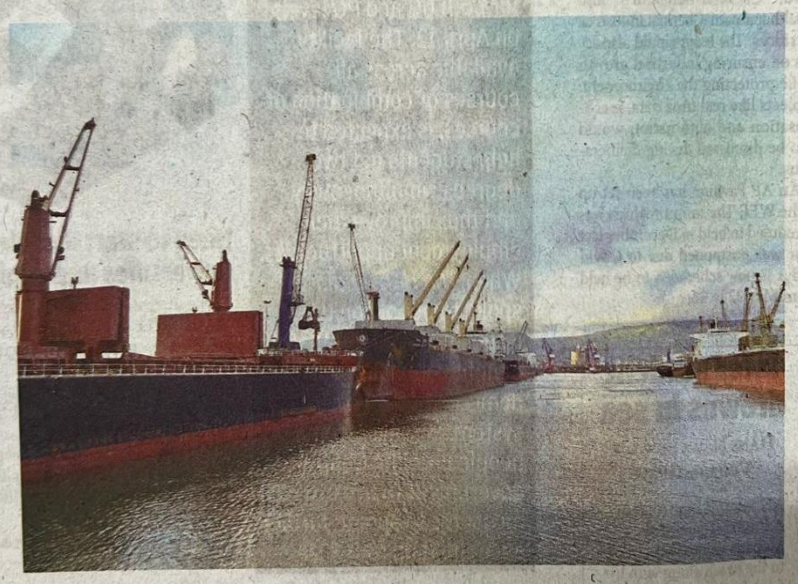
VPA registers highest single day volume for the second time in a month in Visakhapatnam

The highest volume, under-taken combinedly at Inner Harbour, Outer Harbour, including SPM through 22 vessels that worked in the port, was recorded on Thursday. VPA handled a record cargo twice in a span of a month and it is the fourth time in